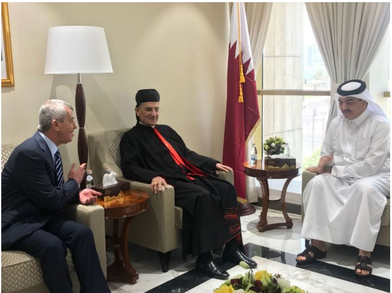
Rahi, who serves as a Cardinal of the Roman Catholic Church